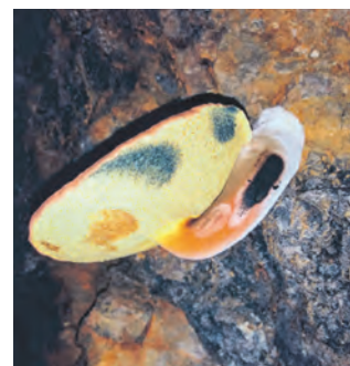
Blick auf den sensationellen Pilzfund: Schwarz-blauer Röhrling.

Unsere Saalfelder Pilzgruppe bedankt sich herzlich bei den Mitarbeitern der Feengrotten für ihre freundliche Kooperation und unsere sehr erfolgreiche Ausstellung!“