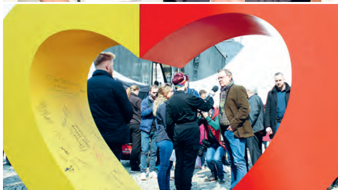
Eindrücke aus der Arbeit des SRB – beim Jubiläum, bei den Zukunftswegen Ost und beim Europafest.