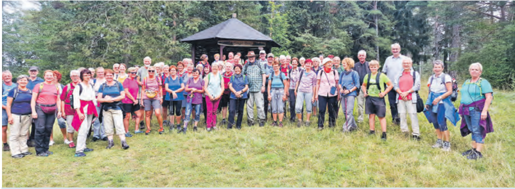
Die sechste gemeinsame Lutherwanderung führte in diesem Jahr am 31. August von Niederwillingen im Ilm-Kreis nach Paulinzella, das in diesem Jahr wegen des Jubiläums 900 Jahre Klosterweihe das ganze Jahr über im Mittelpunkt steht.