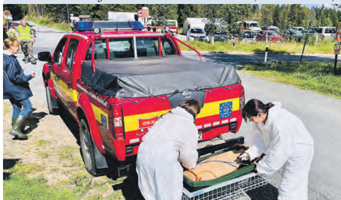
Anschließend rückten Bergungsteams an, um die „Kadaver“ fachgerecht zu entsorgen.