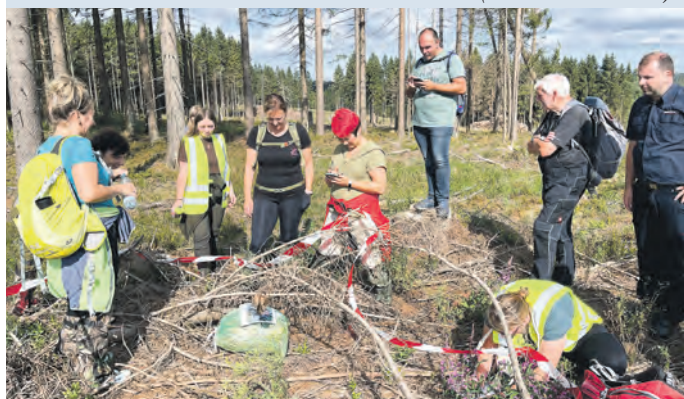
Die Fundstücke mussten dokumentiert und an die Einsatzleitung gemeldet werden.