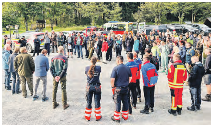
Auf dem Wanderparkplatz erfolgte die Einweisung der Einsatzkräfte.