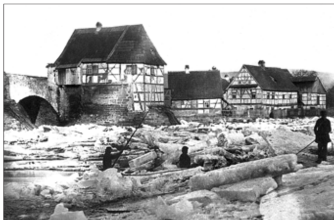
Eisschollen vor der alten Saalebrücke - um 1880

Siehe den Anschlag „Wasserstand 1880“ an der Restaurateur Beyerschen Wohnung zu Köditz. Restaurateur Kreuzer in Oberrnitz hatte ebenfalls Wasser in seiner Wohnung.